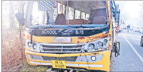
जीद। हादसे में दुर्घटनाग्रस्त हुई स्कूल बस।