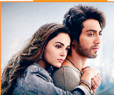
'सैयारा' दर्शकों ने खूब किया पसंद