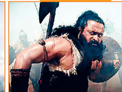
'कांतारा' साल की सबसे सफल फिल्मों में से एक

हॉरर जॉनर ने प्रभाव अवश्य छोड़ा, लेकिन किसी विशेष जॉनर ने सिनेमा में राज नहीं किया। गौरतलब है कि वर्ष 2025 में हॉलीवुड की अलग-अलग जॉनर की फिल्मों देश के विभिन्न हिस्सों में रिलीज की गईं, लेकिन अतीत की तरह किसी खास जॉनर-हॉरर, ड्रामा या सुपरहीरो ने सफलता की गारंटी नहीं दी। आज दर्शक बहुत अधिक चूड़ी हो गए हैं और सिनेमाघर में तभी जाते हैं, जब फिल्म उनकी उम्मीदों के अनुरूप हो। इस नजरिए से 'इंटरस्टेलर' के रि-रिलीज को देख सकते हैं, जो भारत में 2025 में सबसे अधिक कमाई करने वाली हॉलीवुड फिल्म बनी और नई रिलीज से भी आगे निकल गई। 'इंटरस्टेलर' के अतिरिक्त जिन ग्लोबल कि अगर फिल्म निरंतरता के साथ रिलीज हों तो कंडीशन सुधार सकती है। कई वितरकों का तर्क है कि अधिक टेक्स के कारण टिकट्स के दाम बढ़ गए हैं, जिससे दर्शक सिनेमाघरों की तरफ कदम नहीं बढ़ा रहे हैं। बदल रही दर्शकों की पसंद: चेन्नई के एक कार्यक्रम में अभिनेता कमल हासन ने कहा, 'आज क्षेत्रीय, नया राष्ट्रीय बन गया है और देशज, नया अंतरराष्ट्रीय। जो कहानियां मधुर, मालापुरम, मांड्या या मछलीपट्टनम में जन्म ले रही हैं, वह अब क्षेत्रीय सिनेमा नहीं हैं, वे राष्ट्रीय सांस्कृतिक घटनाएं हैं। एक फिल्म जिसकी जड़ें तटीय कर्नाटक में हैं जैसे 'कांतारा', पूरे देश में पसंद की जाती है।' भारतीय मनोरंजन के बदलते लैंडस्केप और ओटीटी की बढ़ती प्रासंगिकता के बारे में हासन का कहना है, 'भारत का मीडिया और मनोरंजन बदल रहा है। आज की कहानियां वास्तव में दर्शक के साथ यात्रा करती हैं।' नहीं चला कोई स्पेशल जॉनर: इस साल दर्शकों द्वारा पसंद की गई फिल्मों की बात करें तो