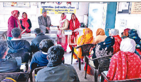
प्रशिक्षण शिविर के समापन पर पशुपालकों को प्रमाण पत्र देते हुए।