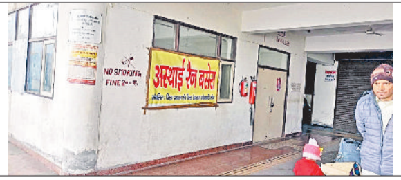
जीद। बस अड्डा पर खाली कैंटीन में बनाया गया रैन बसेरा।

जरूरतमंद लोगों को ठंड में रात के समय ठहरने के लिए जिला रेडक्रास सोसाइटी की ओर से बस स्टैंड परिसर में पहले रोडवेज बस की एक कंडम बस में अस्थायी रैन बसेरा बनाया गया था। अब बस की जगह बस स्टैंड परिसर में खाली पड़ी बड़ी कैंटीन में अस्थायी रैन बसेरा बनाया गया है। ऐसे में यात्रियों को रात के समय पहले की अपेक्षा ठहरने में काफी सुविधा होगी। कंडम बस में जहां केवल दस यात्रियों के ठहरने की व्यवस्था होती थी लेकिन अब बड़ी कैंटीन में दस से ज्यादा मुसाफिर रात