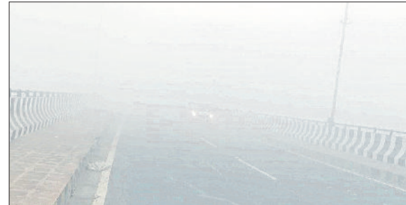
कैथल। सड़कों पर छाई धुंध।

चालक ने टक्कर से बचने के लिए बस को खेतों की तरफ कर दिया। फिर भी अनियंत्रित ट्रक का अगला हिस्सा बस से जा टकराया। रोडवेज बस के पीछे निजी स्कूल बस थी। जिसमें 38 छात्र सवार थे। रोडवेज की टैंकर के साथ भिड़ंत के साथ निजी स्कूल बस चालक ने कट मारा तो स्कूल बस का अगला हिस्सा भी टकरा गया। जिसमें स्कूल बस का शीशा टूट गया। जबकि छात्र तथा यात्री बाल बच गए।