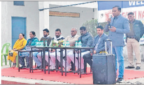
सीवन। कांगथली के स्कूल में कार्यक्रम में भाग लेते अतिथि।