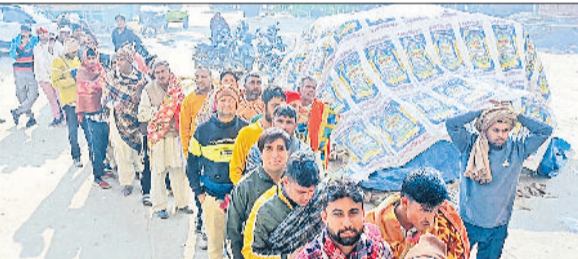
उचाना। यूरिया खाद लेने के लिए लाइन में लगे किसान।