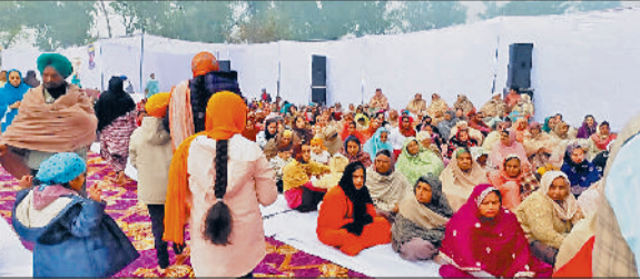
सीवन। कार्यक्रम में पहुंची साध संगत।

नगर में आयोजित शहीदी जोड़ मेले का शनिवार को श्रद्धा, भक्ति और सेवा भाव के साथ विधिवत समापन हो गया। समापन अवसर पर प्रातःकाल अर्धद पाठ का भोग डाला गया, जिसके उपरांत भव्य दीवान सजाया गया। दीवान में रागी जत्थों ने गुरुबाणी का मधुर कीर्तन करते हुए गुरु साहिब के गुणगान से वातावरण को भक्तिमय बना दिया। कड़ाके की ठंड के बावजूद श्रद्धालुओं की आस्था में कोई कमी देखने को नहीं मिली। सुबह से ही बड़ी संख्या में संगत परिसर में