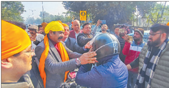
कैथल। वाहन चालकों को हेल्मेट वितरित करते लायंस क्लब के पदाधिकारी।