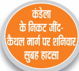
हरिभूमि न्यूज ॥ जीद

गांव कंडेला के निकट जीद-कैथल मार्ग पर शनिवार सुबह उस समय बड़ा हादसा टल गया जब ट्रक, तेल टैंकर, रोडवेज बस तथा निजी स्कूल बस की भिड़ंत हो गई। जिसमें ट्रक चालक, रोडवेज बस चालक समेत दर्जनभर लोग घायल हो गए। जिन्हें उपचार के लिए नागरिक अस्पताल में भर्ती करवाया गया है। घटना के दौरान कुछ समय के रास्ता भी बाधित हो गया था। सदर थाना पुलिस मामले की जांच कर रही है।