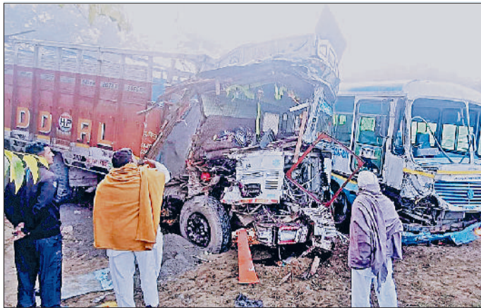
जीद। हादसे में दुर्घटनाग्रस्त हुआ ट्रक व रोडवेज बस व हादसे के बाद लगा जाम।