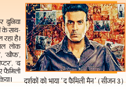
दर्शकों को भाया 'द फैमिली मैन' (सीजन 3)

टॉप ट्रेडिंग ओटीटी शो बीते कुछ वर्षों में एंटरटेनमेंट की एक उमंगान्तर दुनिया विकसित हुई है। इन दिनों थिएटर में रिलीज फिल्मों के साथ-साथ ओटीटी शो को भी दर्शकों का खूब प्यार मिल रहा है। 'द बैड्स ऑफ बॉलीवुड', 'ब्लैक वॉटर', 'पाताल लोक (सीजन 2)', 'पंचायत (सीजन 4)', 'मंडला मर्डर्स', 'खोफ', 'स्पेशल ऑप्स (सीजन 2)', 'आका: द बंगल चैप्टर', 'द फैमिली मैन (सीजन 3)' और 'किंगडम जस्टिस: ए फैमिली मैट' जैसे ओटीटी शो को दर्शकों ने खूब पसंद किया।